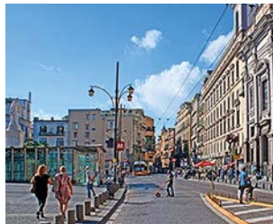
Spacer po Neapolu jest bardzo przyjemny

Budżet – Pokój 2-osobowy można wynająć za mniej niż 100 EUR. Pizza kosztuje od 5 do 10 EUR, a danie mięsne lub rybne od 15 do 20 EUR. Do rachunku doliczana jest opłata za pieczywo i nakrycie w wysokości od