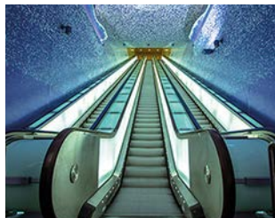
Stacja metra Toledo

Siec – www.anm.it i www.trenitalia.com . Linia nr 1 łączy dworzec Napoli Centrale (piazza Garibaldi) z centrum miasta i Vomero. Niektóre stacje są prawdziwymi dziełami sztuki, np. Toledo lub Università. Linia nr 2 przecina miasto ze wschodu na zachód, biegnie od Gianturco do Campi Flegrei (Pozzuoli Solfatara), przez stacje Napoli Centrale i Mergellina. Linia nr 6 łączy Mostra z Mergellina, docelowo ma prowadzić aż do piazza Municipio.