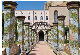
Chiostro di Santa Chiara

Cała dzielnica leżąca na zachód od via Duomo przesiąknięta jest historią. Tu fragment greckiego muru, tam pozostałości z czasów rzymskich lub średniowiecza. W północnej części tego labiryntu kościołów i pałaców znajduje się muzeum archeologiczne, które warto odwiedzić.